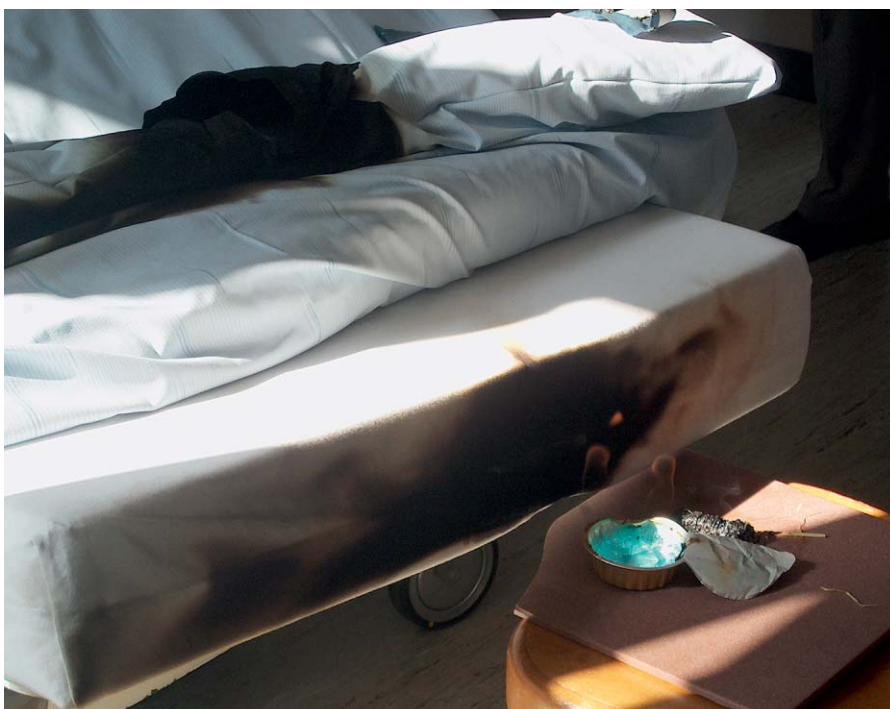
Die Faser löscht von selbst und verkohlt ohne zu tropfen.

► www.ceha5.ch ► www.zimmermannntextil.ch ► www.bischoff-decor.ch ► www.pelisago.ch ► www.haelg-textil.ch ► www.zewiundbebe-jou.ch